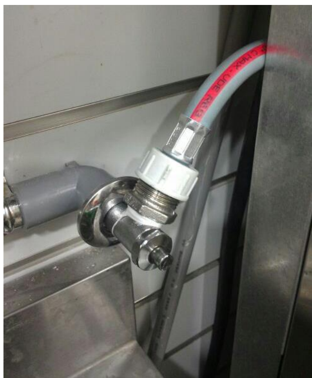
冷水(熱水)進水接頭 (一字凡而)